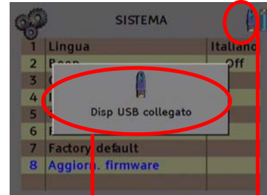
USB 2.0 rilevato da MediaMax EVO