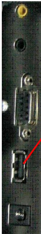
Connettore USB 2.0 del MediaMax EVO